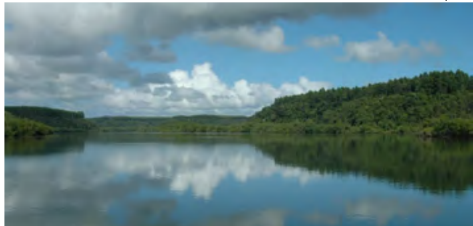
A região hidrográfica Litoral Centro-Norte abrange integralmente os municípios de Aracruz e Fundão.

A população capixaba terá a oportunidade de conhecer o cenário atual da água na região hidrográfica Litoral Centro-Norte. A situação de rios e córregos, como a quantidade e a qualidade das águas, e demais características das bacias dos rios Riacho, Piraquê-açu, Reis Magos e Jacaraípe serão apresentadas durante a 2ª Oficina do Plano de Recursos Hídricos da Região Hidrográfica, que acontece nesta quinta-feira (12), às 9 horas, em Ibirapu. O evento é aberto ao público.