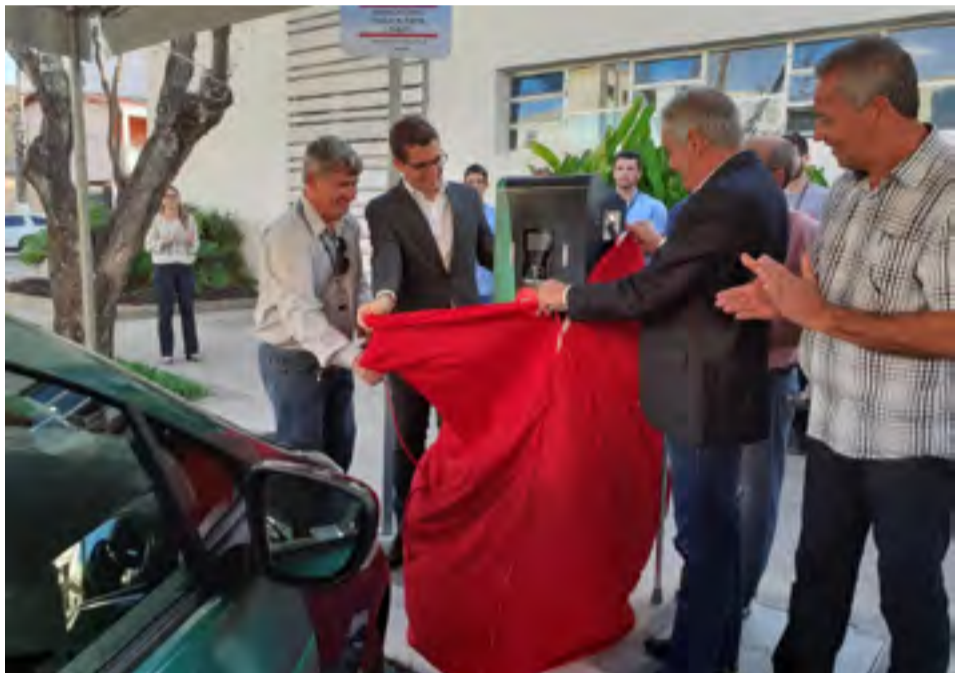
O projeto, que faz parte de uma iniciativa inovadora, conta com um investimento de cerca de R$ 350 mil.