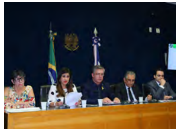
Comissão de Cidadania da Ales debateu questões sobre a taxa de ocupação do Iases Linhares.