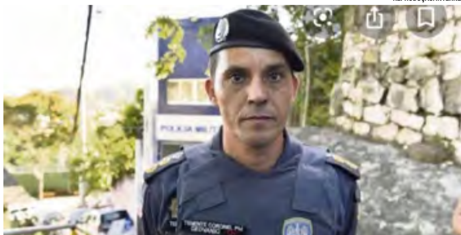
O Tenente-coronel Geovânio Silva Ribeiro

O atual comandante do 12º BPM, Tenente-coronel Gelson Lozer Pimentel, irá atuar na Corregedoria da Polícia Militar. A troca de comando é um procedimento de rotina da PM capixaba.