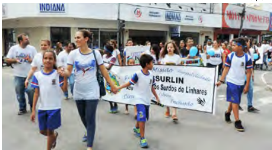
No dia 20 de setembro acontece a 6ª Caminhada da Inclusão, que tem como tema este "INCLUSÃO não é favor, é um DIREITO".

A programação finaliza no dia 29 de setembro (domingo), com um piquenique na Praça 22 de Agosto, para toda família. O encontro começa às 13 horas, com oficinas de Libras, pintura de rosto, jogos, brincadeiras e outras atrações.