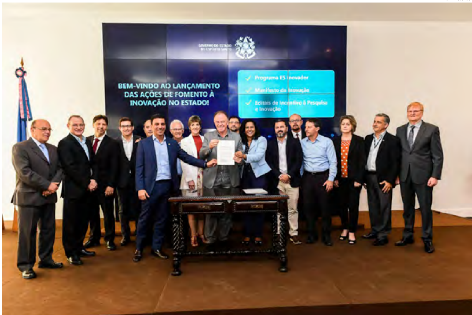
O governador Casagrande afirmou que o objetivo das ações é a promoção do ambiente de inovação no Espírito Santo.