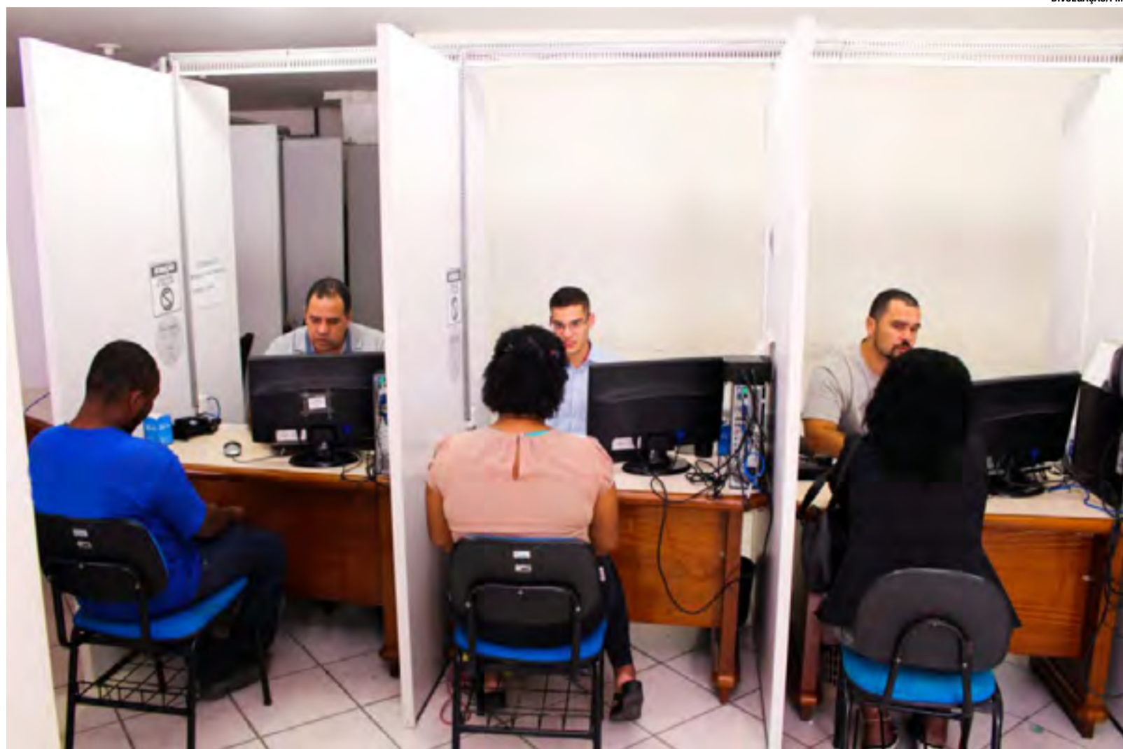
Atualmente tramitam 16 reclamações no Procon Linhares – o restante dos atendimentos foi solucionado de maneira preliminar.

“Mais do que festejado, o marco serve como um momento de reflexão em relação