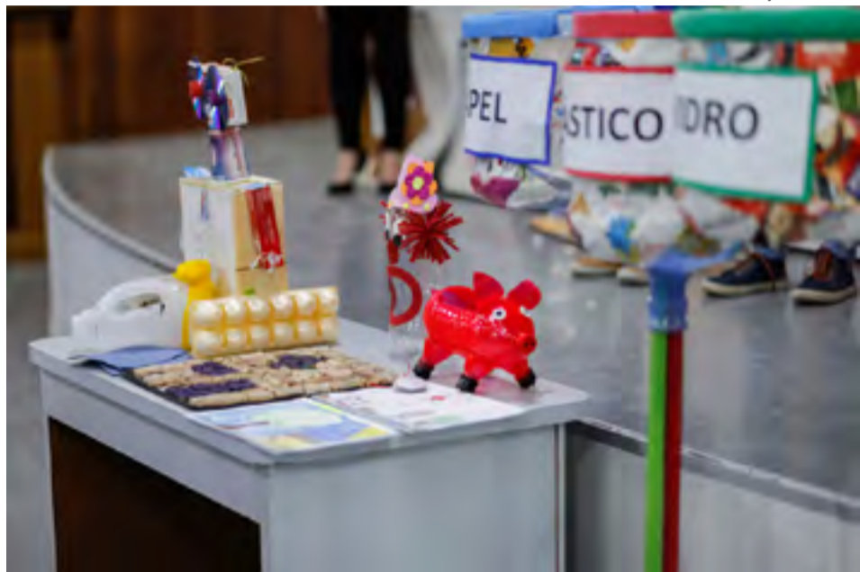
Com o projeto Estação Sustentável, desenvolvido em escolas de Linhares, resíduos ganham novo uso e destinação correta.

Há também um último ponto que considero importante discutir nessa coluna.