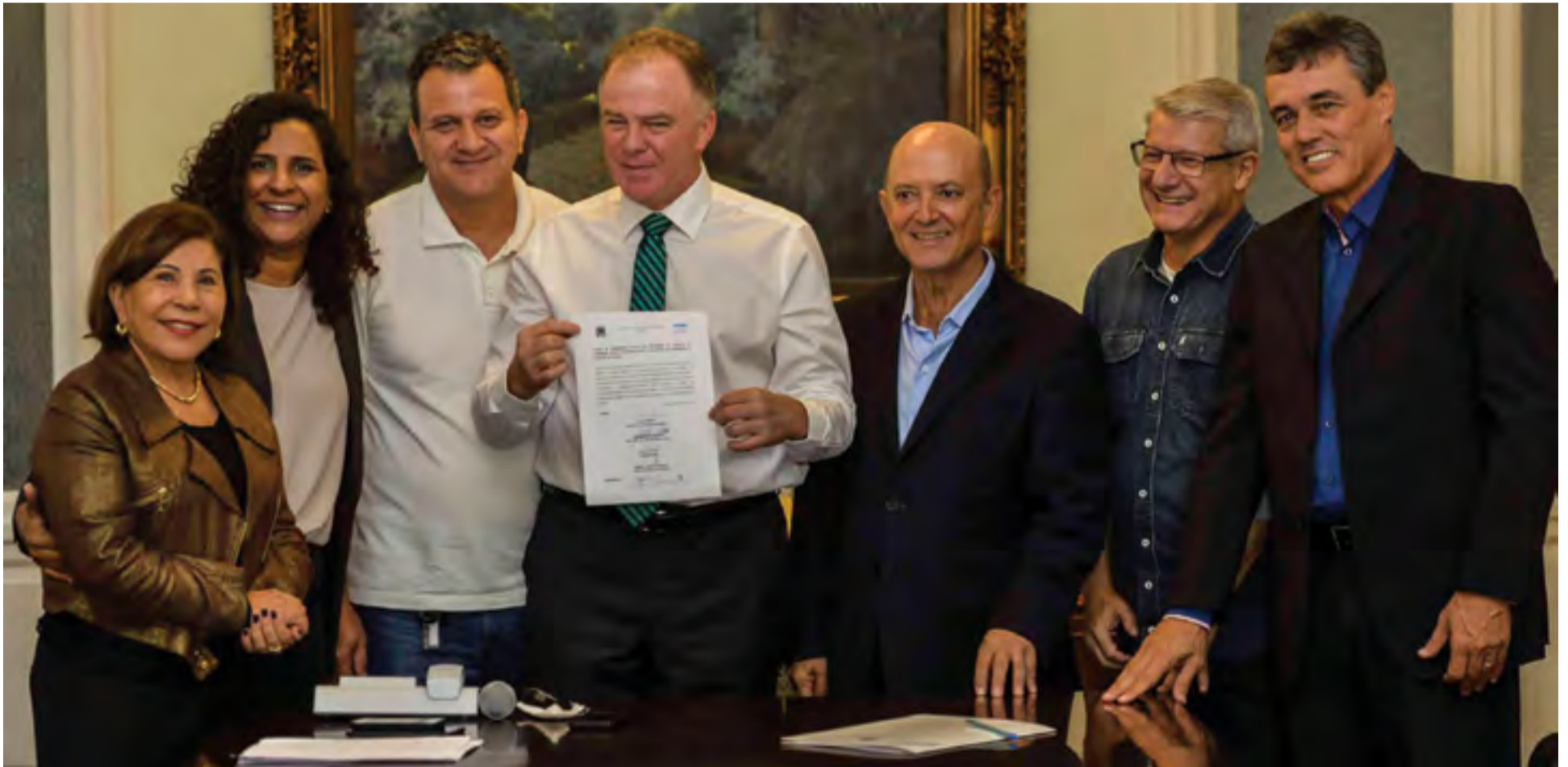
Acordo foi firmado pelo Governo do Estado, por meio do Incaper, e o Ministério da Cidadania