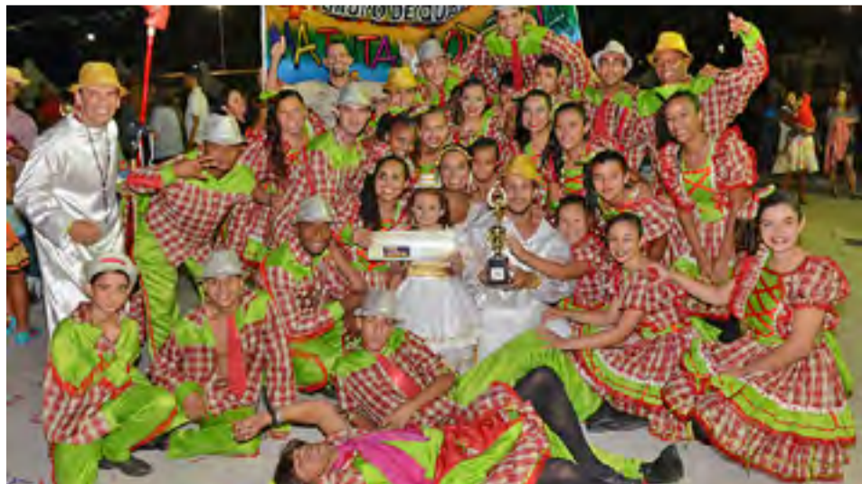
Além da premiação em dinheiro, os vencedores do festival de quadrilhas serão convidados para participar de eventos culturais, como o Forró do Pontal e a Virada Cultural.

Prazo termina na próxima sexta-feira (14). Festival vai distribuir R$ 5 mil em prêmios