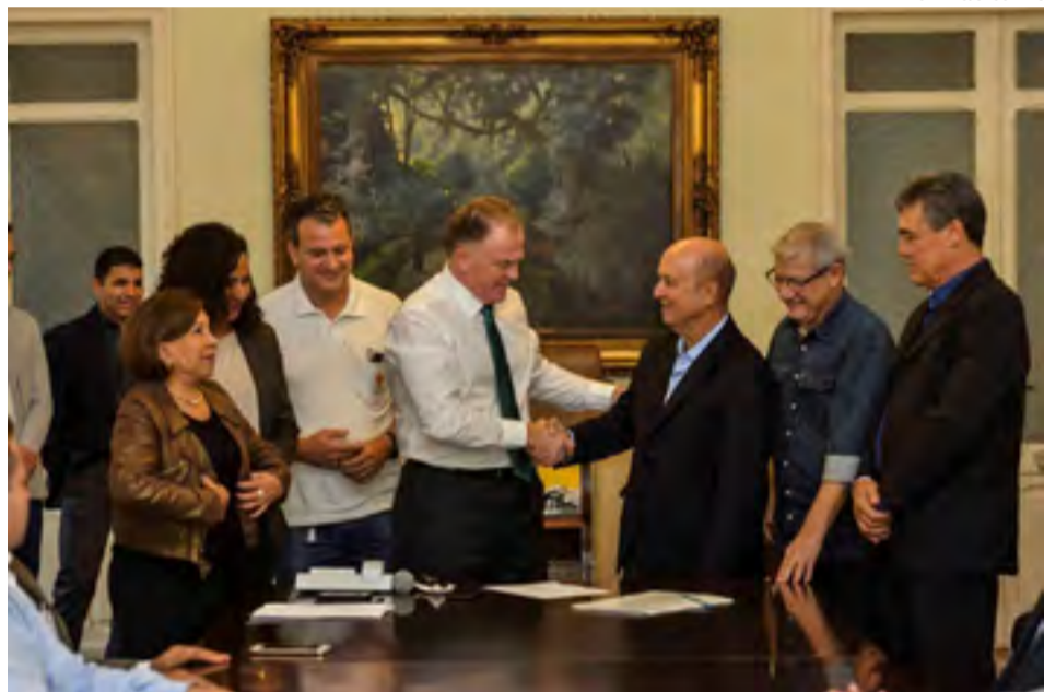
Acordo de Cooperação permite que famílias rurais de baixa renda recebam apoio técnico do Incaper