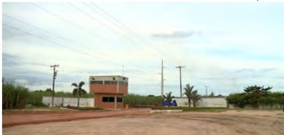
Homem desaparecido é funcionário de uma indústria de produção de álcool em Linhares