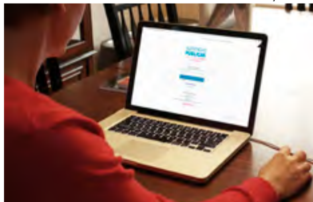
O site Orçamento em Rede, que pode ser acessado por computador, smartphone e tablete, permanecerá no ar até o dia 23 de julho