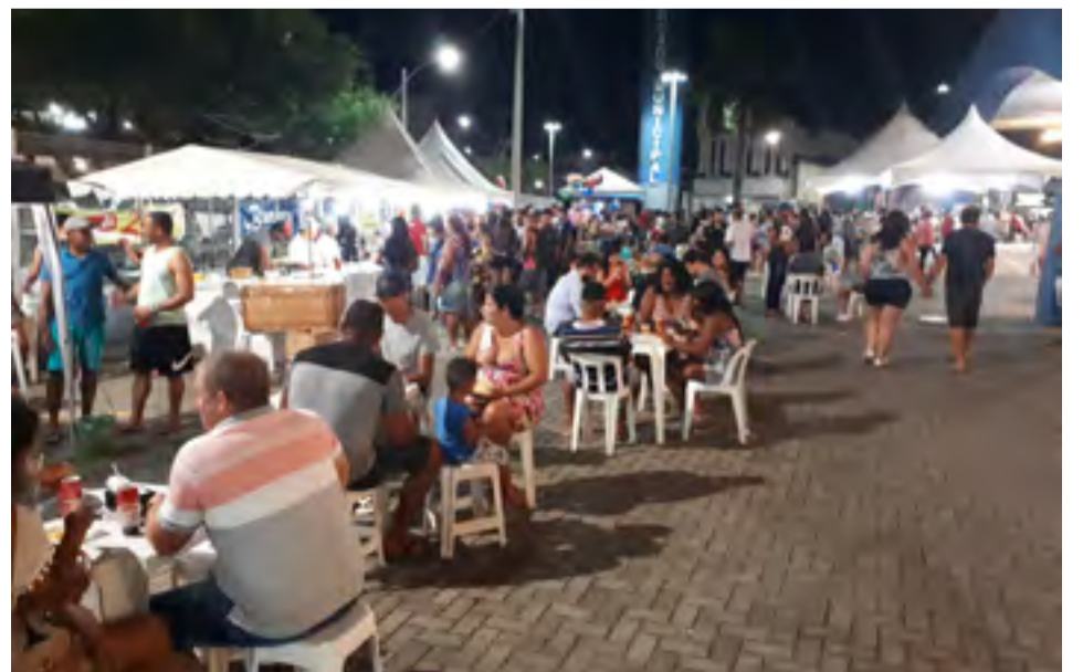
Além das tradicionais barracas gastronômicas, o público também vai prestigiar as apresentações musicais e culturais no Mercado Municipal